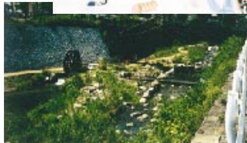
水辺の楽校となかよしの水辺（板櫃川 / 北九州市）

もう一つは、中心市街地等で失われつつある都市住民のコミュニティ復活に関する役割である。大都市では居住人口が減少し、古くからの歴史・文化の喪失、コミュニティの崩壊等の問題があり、また、地方都市においても魅力の低い市街地環境等により、人口の減少・高齢化等の問題が発生し、市街地の衰退・空洞化が進行している。