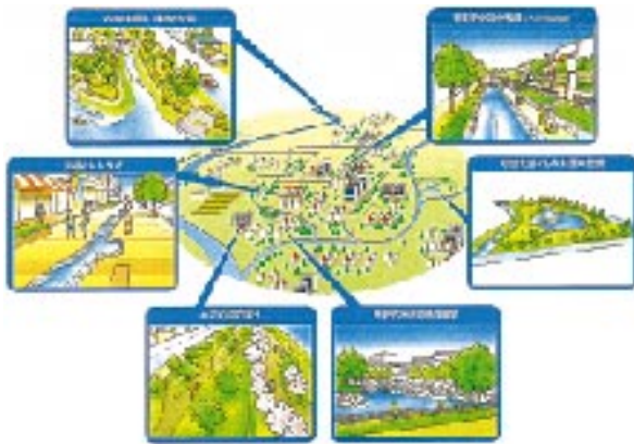
水と緑のネットワーク