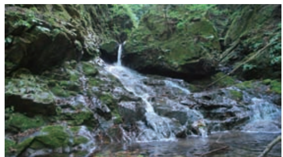
流域のNGOが水源の森をナショナル・トラスト活動で買い上げ永久保全地としています

氾濫原の再生も視野に、河川を基軸とした流域の、また全国、東アジアレベルの生態系ネットワークによる持続可能な社会の実現を強く期待し、（公財）日本生態系協会としてその推進に全力で貢献していきたいと考えています。