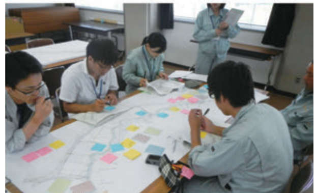
図-2 岡山県多自然川づくり講座の様子