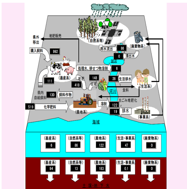
図 - 2 岩手県におけるリンの循環