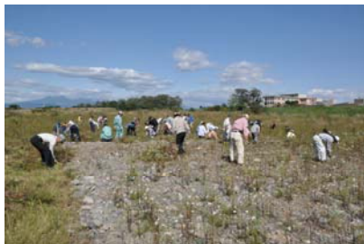
写真-2 シナダレスズメガヤ除去作業

本報告は、平成22年3月以降、平成26年2月の第7回まで、年1~2回のペースで開催されてきた「鬼怒川の外来種対策を考える懇談会」(以下「懇談会」という)を中心とした地域連携方策についてとりまとめたものである。