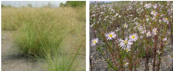
写真-1 シナダレスズメガヤ(左)とカワラノギク(右)

このため、礫河原固有生物の生息・生育に適した環境の再生を目的とした礫河原再生事業が進められている。また同時に、地元市民団体を中心に、カワラノギク等の礫河原固有植物の保全を目的としたシナダレスズメガヤ等の外来植物除去活動の取り組みが活発に進められてきたものの、その取り組み範囲は限定的であった。