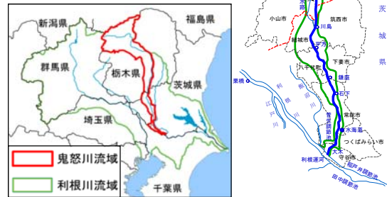
図-1 外来種対策の取り組み区間位置図