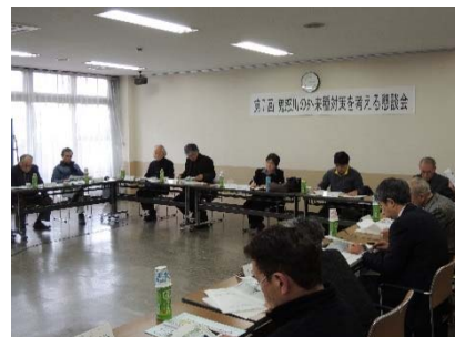
写真-3 第7回懇談会の様子

平成26年2月6日に開催された平成25年度の第7回懇談会では、今後の地域連携方策としてシルビアンジミやオキナグサ等の貴重な動植物の密猟対策、及び普及啓発のためのホームページ運営の必要性について確認された。